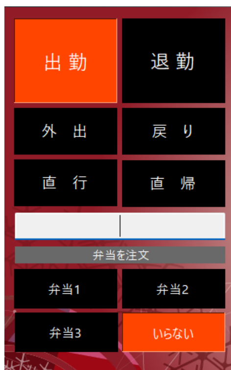
▲ 通常メニュー画面

タッチパネル型出退勤システムです。 社員証をバーコードリーダーにかざすだけでタイムカードの打刻が完了します。